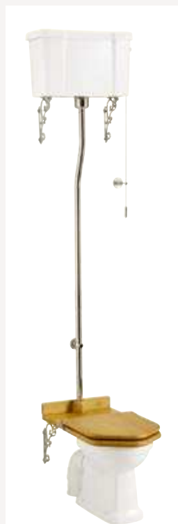
Белая керамика Размер: ширина 51 см х длина 67 см Общая высота: от 238 см до 230 см Труба может быть подрезана на 8 см Цвет покрытия: Хром Как на фото: (P2 + C5 + T30CHR)