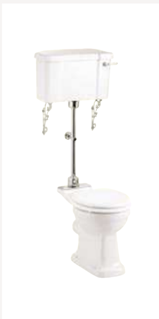
Размер: ширина 51 см х длина 71 см Общая высота: 142 см Цвет покрытия: Хром Как на фото: (P5+C1+T33CHR)

Унитазы Burlington соответствуют всем раковинам Burlington (Victorian, Edwardian, Georgian, Classic&Contemporary) – их сочетание зависит только от стиля, дизайна и размера ванной комнаты. Унитаз расходует 4,5 литра воды для полного слива!!!