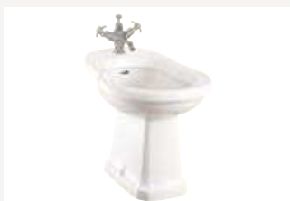
Биде Размер: ширина 39 см х длина 56 см Общая высота: 40 см Как на фото: (P4)