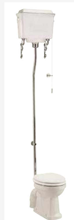
Белый алюминий Размер: ширина 43 см х длина 67 см Общая высота: от 240 см до 232 см Труба может быть подрезана на 8 см Цвет покрытия: Хром Как на фото: (P2+T59WHI+T30CHR)