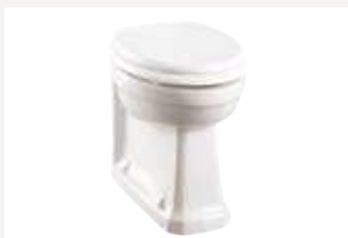
Унитаз пристенный Размер: ширина 36,5 см х длина 48 см Общая высота: 42 см Как на фото: (P14)