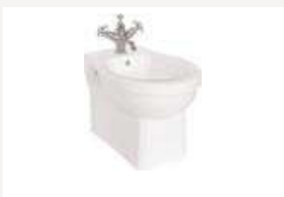
Биде подвесное Размер: ширина 35,5 см х длина 50 см Общая высота: варьируется Как на фото: (P11)