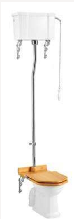
Белая керамика Размер: ширина 52 см х длина 67 см Общая высота: от 240 см до 232 см Труба может быть подрезана на 8 см Цвет покрытия: Хром Как на фото: (P2+C28PK+T30CHR) Бачок с одинарной системой слива (на 6 л)