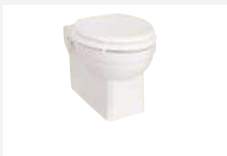
Унитаз подвесной Размер: ширина 35,5 см х длина 50 см Общая высота: на усмотрение клиента Как на фото: (P10)